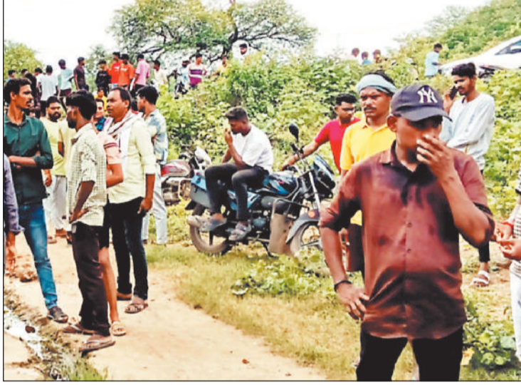
घटनास्थल पर लगी ग्रामीणों की भीड़।