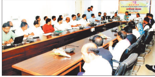
समीक्षा बैठक लेते प्रभारी मंत्री ओपी चौधरी।

प्रभारी मंत्री ने जिले में संचालित निर्माण कार्यों की समीक्षा बैठक से समीक्षा की गई। इस बैठक में प्रभारी मंत्री श्री चौधरी ने वित्तीय वर्ष 2024-25 एवं 2025-26 के बजट में स्वीकृत, प्रगति एवं अप्रारम्भ कार्यों की जानकारी सभी विभागों से ली। उन्होंने जशपुर में पीएम जनमन योजनाएं प्रारंभ किये जा रहे कार्यों की जानकारी लेते हुए इन्हें प्राथमिकता से पूर्ण कराने के निर्देश दिए। उन्होंने कहा कि जिले के सुदूर वनांचलों में विकास करना शासन का लक्ष्य है, पीएम जनमन योजना, धरती आवा ग्राम उत्थान योजना द्वारा इन क्षेत्रों का समन्वित विकास किया जाना है। योजनांतर्गत किये जा रहे कार्यों में कार्य में गुणवत्ता का विशेष ध्यान रखने और कर्मठता के साथ प्रत्येक कार्य को समय सीमा में पूर्ण करने के निर्देश दिए। उन्होंने जनप्रतिनिधियों और अधिकारियों को आपस में चर्चा कर समन्वय के साथ काम करने की अपील भी की।