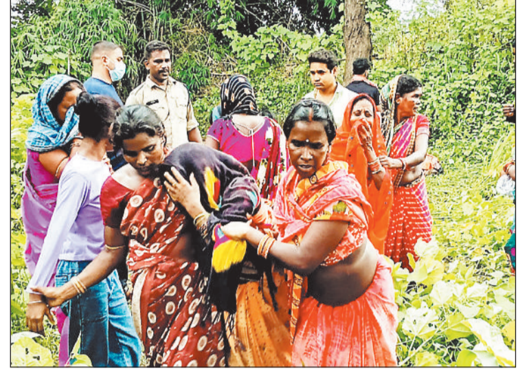
मृतकों का शव ले जाते परिजन।