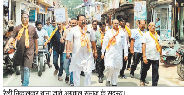
रैली निकालकर थाना जाते अग्रवाल समाज के सदस्य।