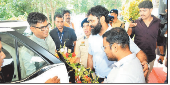
प्रभारी मंत्री का स्वागत करते कलेक्टर व अन्य अधिकारी।

उन्होंने जिले में पर्यटन को बढ़ावा देने के लिए दनगरी जलप्रपात पहुंच मार्ग सहित अन्य आवश्यक निर्माण कार्यों जल्द से जल्द पूरा कराने को कहा। उन्होंने सभी निर्माण कार्य कराने वाले विभागों की समीक्षा कर कहा कि जशपुर एक आदिम बहुल जिला होने के साथ मुख्यमंत्री श्री विष्णुदेव साय का गृह जिला भी है इसे हमें एक मॉडल के रूप में विकसित करना है।